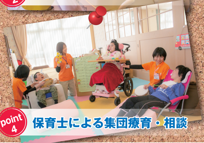
point 4 保育士による集団療育・相談