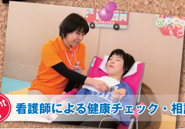
point 3 看護師による健康チェック・相談