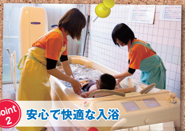
point 2 安心して快適な入浴